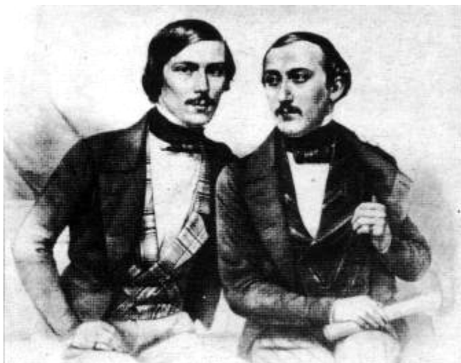
Bottesini és Ardití