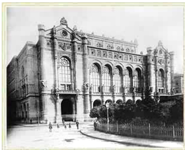
A Pesti Vigadó a XIX. szd.-ban