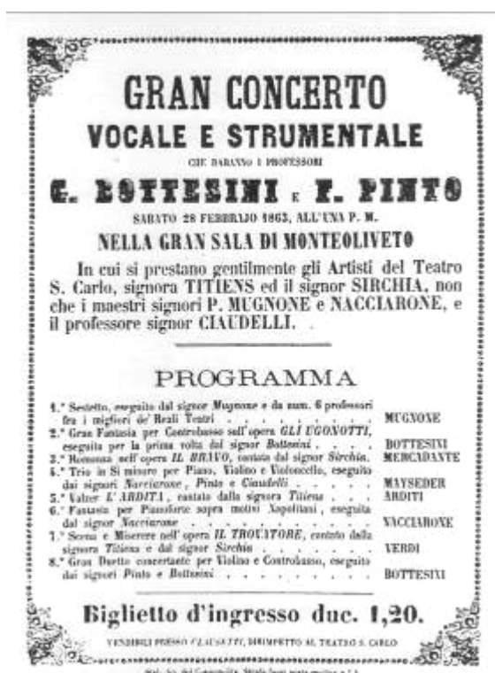
Az 1863. február 28-i koncert műsora

társaságnak rögtön a megalakulásakor már hetven tagja van, s az első koncertjét szeptember 14-én a Monteoliveto Teremben tartja. A műsoron Mozart B-dúr vonósnygyese (K. 159), Bottesini Mercadanténak ajánlott vonósötöse és Beethoven Szeptettje (op. 20.) szerepel. A Vonósnygyes Társaság nyomtatott formában is terjeszteni kívánja a kamarazenét, ezért a firenzei Guidi Kiadóval karöltve több quartett (többek között két Bottesini) kispartitúráját publikálja 105 . A nagy kezdeti lelkesedést követően azonban a társaság kilenc havi működés után megszűnik. A kamarakonzertek mellett szólófellépései is vannak a mesternek Nápolyban a Fondo Színházban (Teatro Fondo) és az Operában (San Carlo). Ősszel értesül róla, hogy D-dúr vonósnygyesével 106 megnyerte a Basevi-versenyt. Az ünnepélyes díjátadásra és a győztes mű bemutatására november 1-én Firenzében a Királyi Szépművészeti Akadémia Vigadó Termében kerül sor (Sala del Buon Umore della Regia Accademia delle Belle Arti) neves művészek (Giovacchini, Agostini, Lachi és Sbolci) tolmácsolásában. A szerző azonban nincs jelen, mert októberben Párizst érintve Angliába utazott. Ismét egy Beale szervezésű turnén vesz részt, melynek során november végén 15 napig Írországbban is vendégszerepel. Ekkor tűzi először műsorra a Lucia fantáziát (Fantasia Lucia) 107 . Év végére visszatér Itáliába: Rómában Ettore Pinelli hegedűművésszel koncertezik.