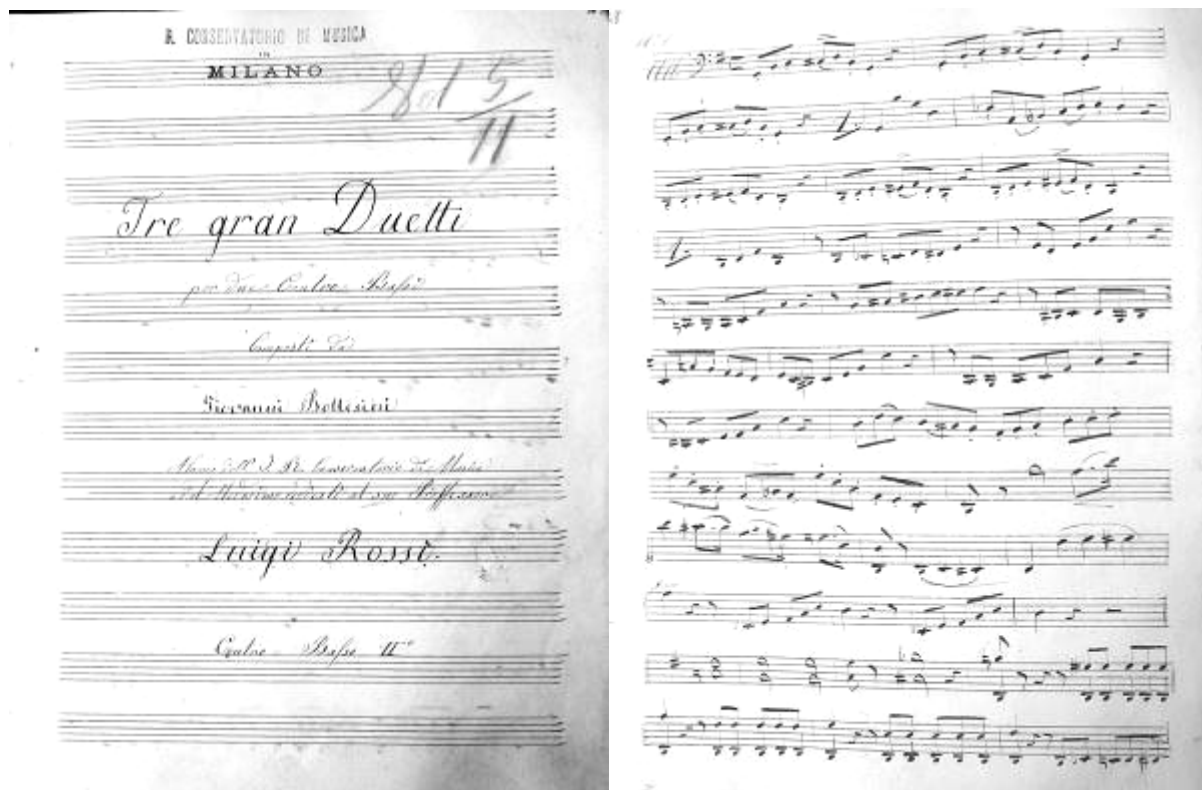
Bottesini autográfja (JGB 9.83): a második bőgő szólamának címlapja és első oldala

– autográf: datálás nélküli II. bőgő szólam G-dúrban, I-MI-bcm, könyvtári jelzet: A-30 / 29-2; címlap: Tre gran Duetti / per due Contro-Bassi / Composti da / Giovanni Bottesini / Alunno dell'I. R. Conservatorio di Musica / e dal Medesimo dedicati al suo Proffessore [sic] / Luigi Rossi // Contro-Basso II°.