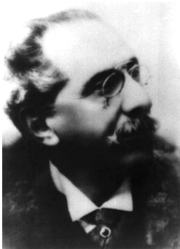
Az idős mester

képet kapjanak a többi (esetleg nyomtatásban még meg sem jelent) műről is, de ilyen jegyzék még a mai napig sem létezik. Voltak olyanok, akik monográfiát írtak Bottesiniről, de ezek csak felsorolás-szerűen közlik a műveket, rendkívül sok hibával, hiányossággal, pontatlansággal. Bottesini – ami a nagybőgőre írt kompozícióit illeti – majdnem minden művéből több változatot is lejegyzett (zongora-, vonós- vagy nagyzenekari kísérettel), s gyakran egyazon mű különböző változatai között hangnemi eltérés is található. A mester ugyanis három húros nagybőgőjét pályája során kétféleképpen hangolta: leggyakrabban Á -ra ( Á, É, H ) – ez megegyezik a ma is használatos ún. szólóhangolással ( Á, É, H, Fisz ) –, de néha még egy fél hanggal följebb: B -re ( B, F, C ). Feltételezhetően az időjárásfüggő bélhúrok változó feszessége és az Á hang magasságának földrajzi területenkénti jelentős különbözősége készítette arra, hogy hol ezt, hol azt a hangolást használja. Így aztán sok művéből két hangnemben is létezik szerzői kézirat. A mai szinte kaotikus helyzet abból adódik, hogy a korábbi monográfiák szerkesztői minden egyes kéziratot külön műként tüntetnek föl. Feltehetőleg nem volt módjuk egyenként áttanulmányozni a manuscripteket, hanem csak bekérték a világ különböző könyvtáraiból a katalógusban szereplő Bottesini művek címét, és mind felsorolták azokat.