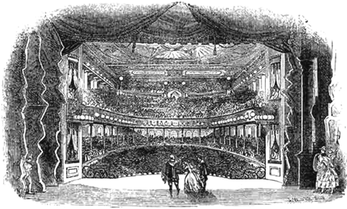
A Niblo's Garden a XIX. szd. közepén

1850. A tavaszi szezon után a társulat az Egyesült Államokba indul. New Yorkban előbb a Niblo's Gardenben a Normát, a Lucrezia Borgiát, az Attilát, a La favoritát, Lammermoori Luciát és a Macbethet játsszák, majd az Astor Place Színházban (Astor Place Theatre) a hugenottákat 52 . Közben Arditivel továbbra is szólózik, s a New Yorki Filharmóniai Társaság tiszteletbeli tagjává választják. Szeptemberben saját operatársulatot szervez (Bottesini's Italian Opera Company), mellyel bejárja az Egyesült Államokat. Októberben az operaszezonra visszamegy Kubába.