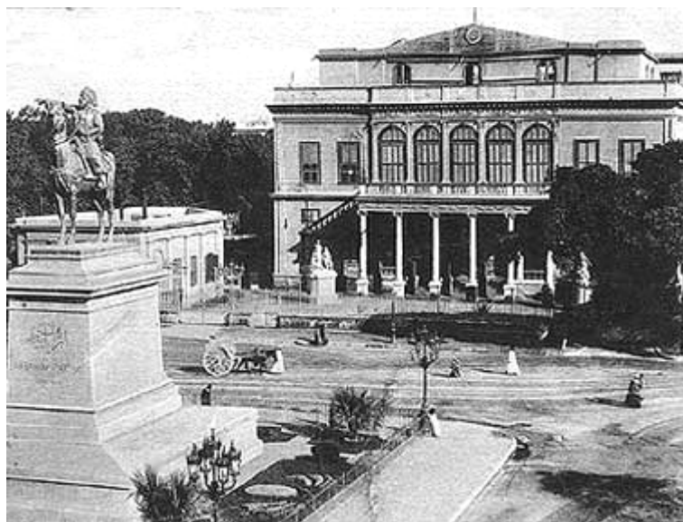
A Kedive Operaház Kairóban

Visszatér Itáliába, hogy Verdivel konzultáljon az Aidával kapcsolatban, mielőtt elindulna Afrikába. Sant'Agatai otthonában keresi föl a szerzőt, s három napig vendége marad, hogy mindent alaposan át tudjanak beszélni. Ha már ily közel jár szülővárosához (Sant'Agata 50 km-re van Cremától), hazalátogat, s egy koncertet is ad az otthoniak nagy örömeire. Egyiptomba hajózik, s november elején elkezd próbálni az új operát. A szerző és a karmester az egész próbaidőszak alatt levél-kapcsolatban áll egymással, s különösen Verdi december 27-én kelt leveléből tudjuk, hogy mekkora hálát érzett Bottesini odaadó munkája iránt. Az ősbemutatóra december 24-én kerül sor, a siker híre azonnal bejárja a világsajtót (Perseveranza, Journal des débats, Wadi el Nil, Il programma, Avvenire d'Egitto stb.) Ebben a sikerben kétség kívül hervadhatatlan érdemei vannak Bottesini áldozatos munkájának és zenei nagyságának is.