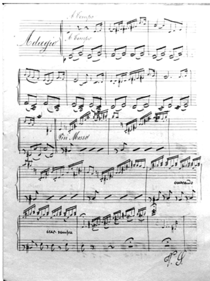
Bottesini autográfja, a Fantasia Lucia (JGB 9.34) prím stímmjének egy lapja. Az alsó sorban az első hegedű szólama, a felsőben a szóló bögő szólama olvasható.

A zenekari szólamanyagot végig lapozva sok értékes információra bukkantam. A legfontosabb tény, hogy ezt teljesen autentikusnak tekintem – függetlenül attól, hogy a szerző vagy egy másoló kezétől származik-e –, miután belőle magát a maestrót kísérték. Sok segítséget jelentenek azok az első-hegedű szólamok is, melyekbe a hegedű-szólam fölé a szólóbögő szólamát is lejegyezte a mester. Minthogy ő maga is dirigált, nyilván sokszor játszott karmester nélkül. De miután játék közben nem mindig tudta a karmesteri feladatát is ellátni, ilyenkor a koncertmesternek kellett a zenekarvezető szerepét átvennie, ehhez volt szükség a fentebb említett kétsorban lejegyzett prím-szólamokra.