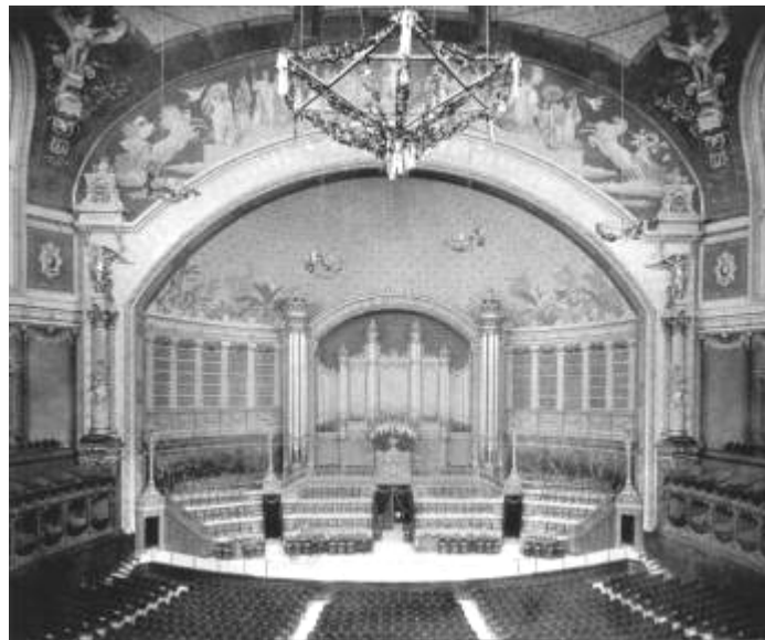
A párizsi Trocadéro nagyterme