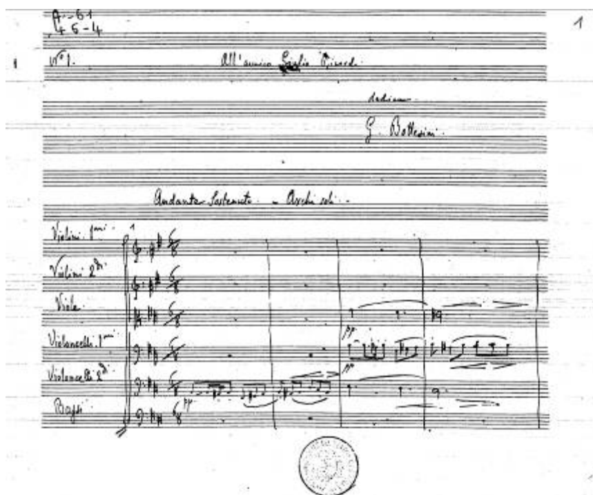
Az Andante Sostenuto (JGB 6.41) kézirtának első lapja

Műcímek: az életrajzban a művek címét az aktuális formában (ahogy az újságban, a koncertplakáton, a nyomtatott kottán stb. megjelent), és magyarul is közlöm, végül lábjegyzetben föltüntetem a jegyzékszámot is. A műjegyzékben azonban minden művet a szerzői kéziratán szereplő címmel szerepeltetek. Ha egy kompozícióból több autográf is létezik, akkor a vélhetően legutolsó, letisztázott kéziratán szereplő címet választottam a műjegyzékben szerepeltetendő megjelölésnek, a többit a forrásoknál tüntetem föl.